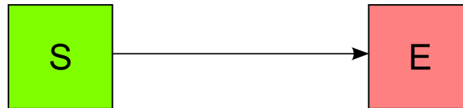
Abbildung 1: Richtungsverkehr. Sender und Empfänger liegen im selben Band.